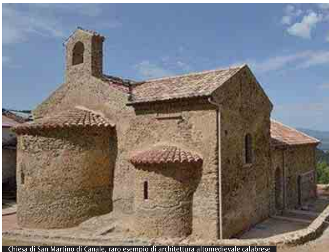
Chiesa di San Martino di Canale, raro esempio di architettura altomedievale calabrese