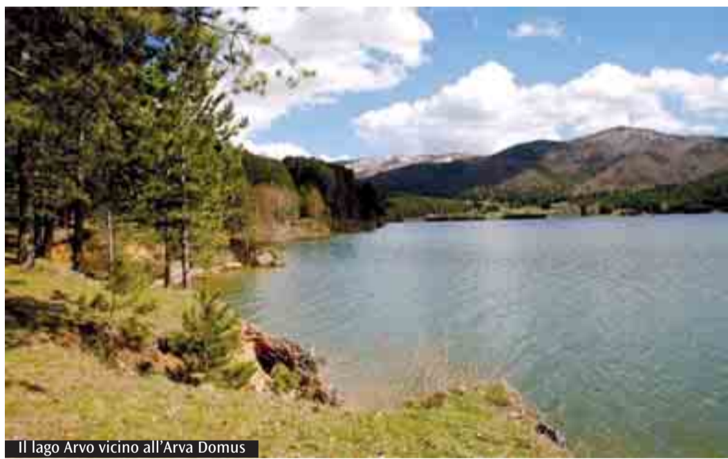
Il lago Arvo vicino all'Arva Domus